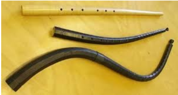
*hudební nástroj cink