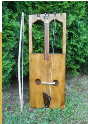
*hudební nástroj chrotta